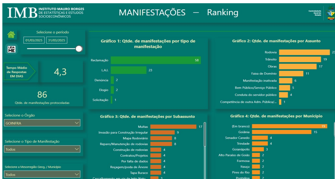
Fig. 01

Ao analisar a figura 01, observa-se a quantidade de manifestações cadastradas, os tipos de manifestações, a quantidade por assunto, por subassunto e por município.