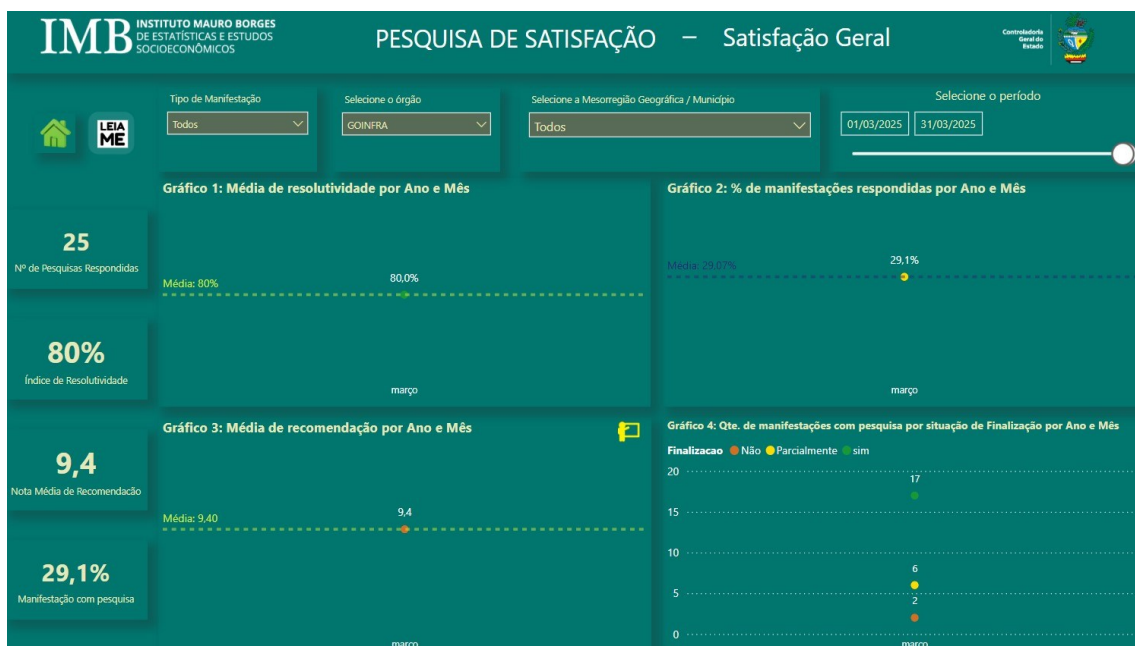
Fig. 02

Com base na Fig. 02, é necessário informar que as manifestações protocoladas podem ser avaliadas pelo manifestante por meio de uma Pesquisa de Satisfação após o manifestante receber a resposta conclusiva enviada pela ouvidoria.