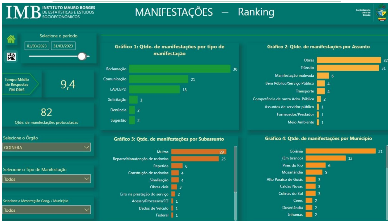
Fig. 01

Com base na Fig. 01, é necessário informar que as manifestações protocoladas podem ser avaliadas pelo manifestante por meio de uma Pesquisa de Satisfação após o manifestante receber a resposta conclusiva enviada pela ouvidoria. Essa avaliação feita pelo manifestante gera indicadores importantes, são os seguintes: