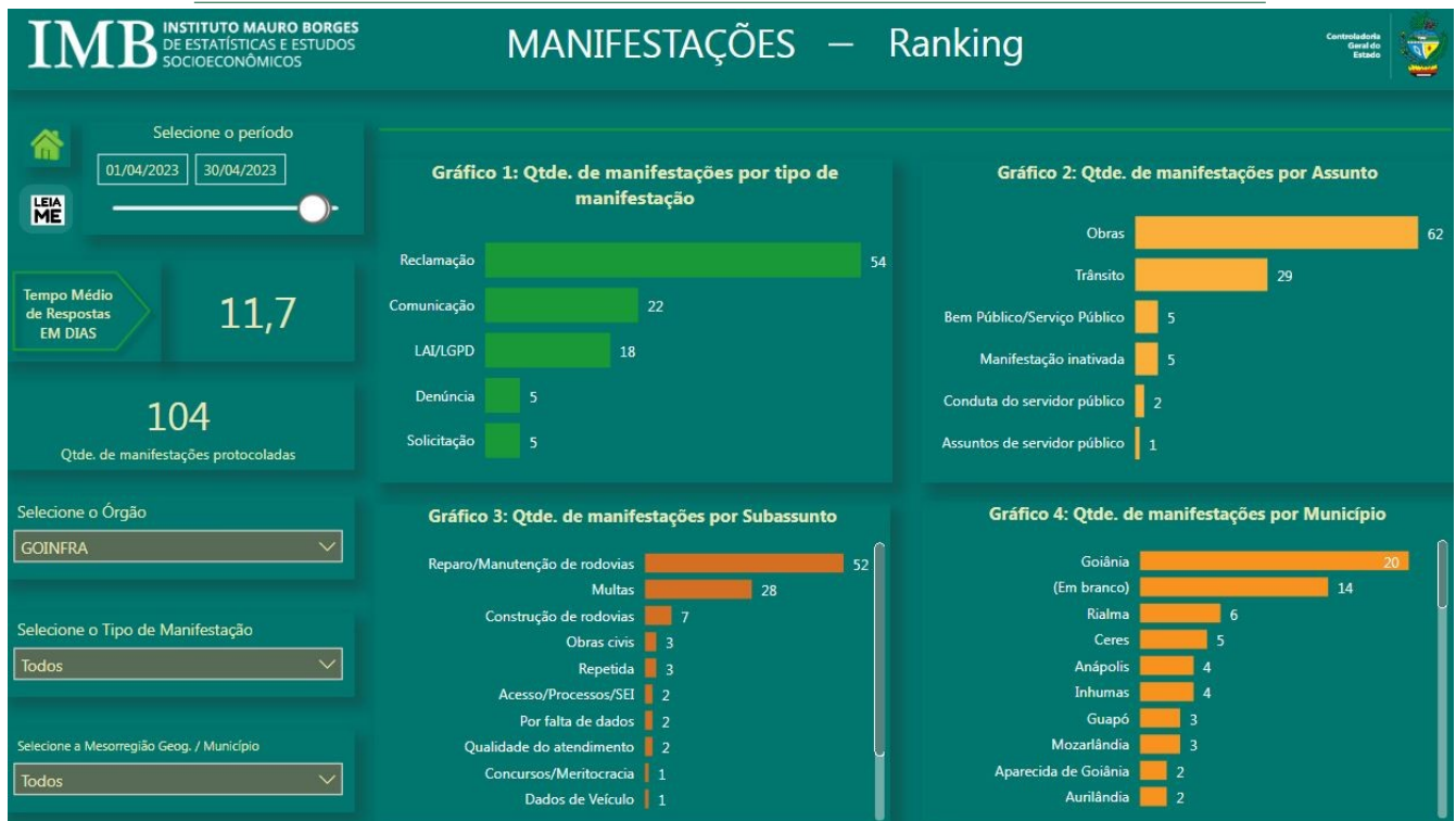
Fig. 01

Com base na Fig. 01, é necessário informar que as manifestações protocoladas podem ser avaliadas pelo manifestante por meio de uma Pesquisa de Satisfação após o manifestante receber a resposta conclusiva enviada pela ouvidoria. Essa avaliação feita pelo manifestante gera indicadores importantes, são os seguintes: