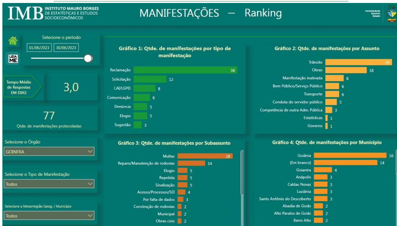
Fig. 01

Com base na Fig. 01, é necessário informar que as manifestações protocoladas podem ser avaliadas pelo manifestante por meio de uma Pesquisa de Satisfação após o manifestante receber a resposta conclusiva enviada pela ouvidoria. Essa avaliação feita pelo manifestante gera indicadores importantes, são os seguintes: