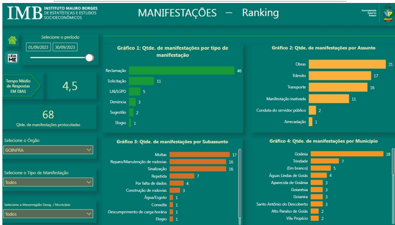
Fig. 01

Com base na Fig. 01, é necessário informar que as manifestações protocoladas podem ser avaliadas pelo manifestante por meio de uma Pesquisa de Satisfação após o manifestante receber a resposta conclusiva enviada pela ouvidoria. Essa avaliação feita pelo manifestante gera indicadores importantes, são os seguintes: