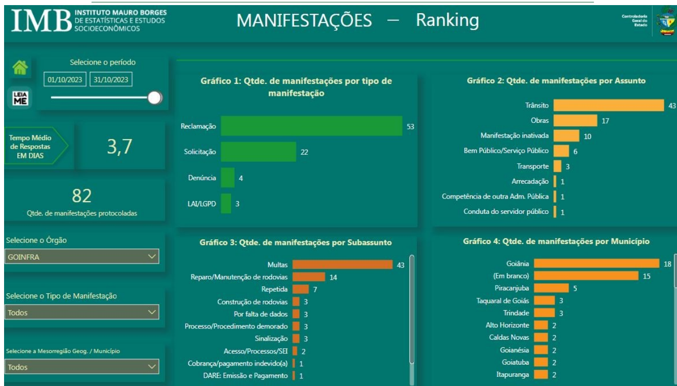
Fig. 01

Com base na Fig. 01, é necessário informar que as manifestações protocoladas podem ser avaliadas pelo manifestante por meio de uma Pesquisa de Satisfação após o manifestante receber a resposta conclusiva enviada pela ouvidoria. Essa avaliação feita pelo manifestante gera indicadores importantes, são os seguintes: