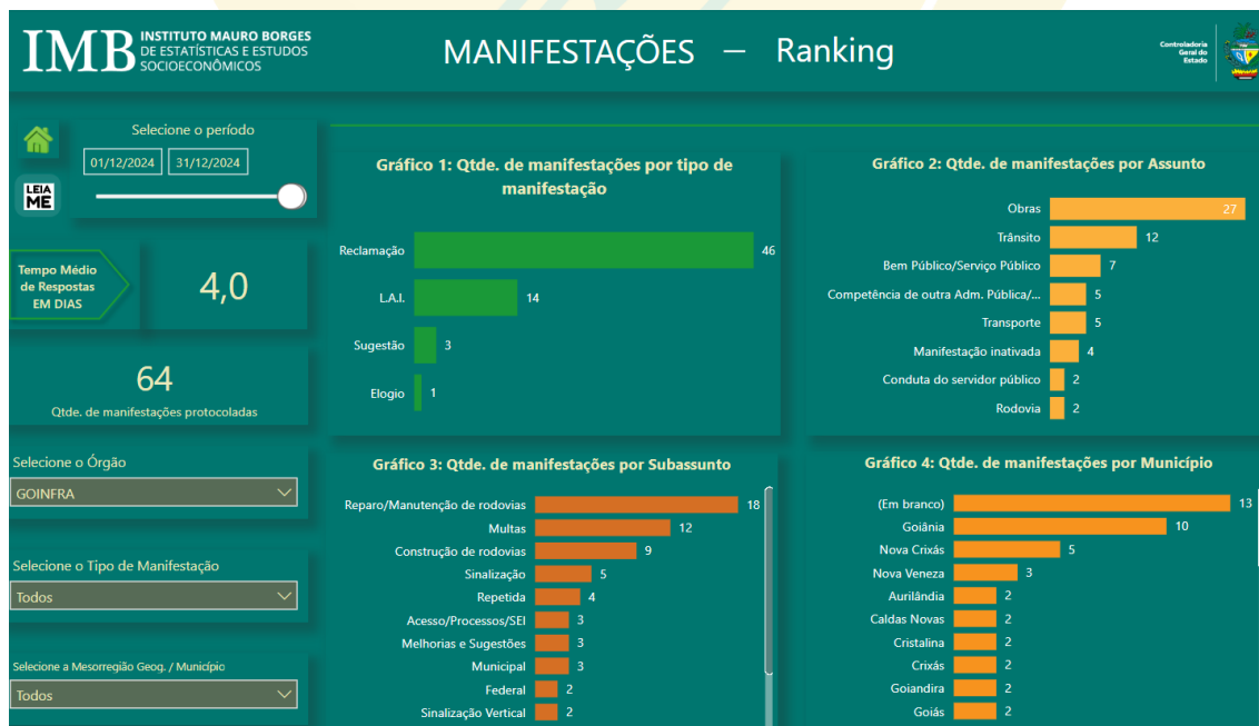
Fig. 01

Ao analisar a figura 01, observa-se a quantidade de manifestações cadastradas, os tipos de manifestações, a quantidade por assunto, por subassunto e por município.