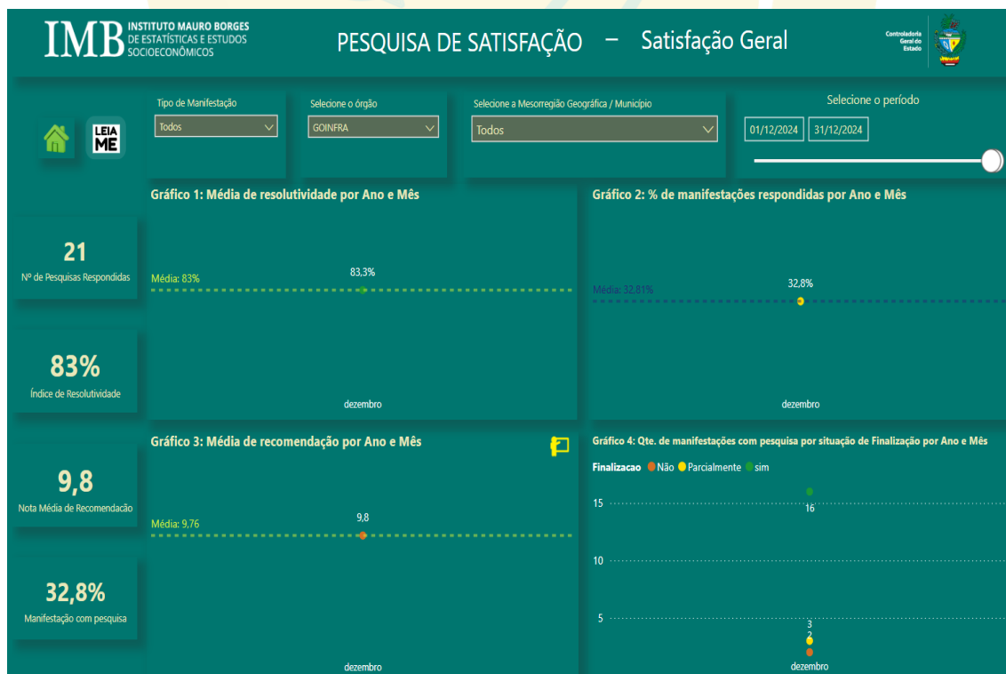
Fig. 02

Com base na Fig. 02, é necessário informar que as manifestações protocoladas podem ser avaliadas pelo manifestante por meio de uma Pesquisa de Satisfação após o manifestante receber a resposta conclusiva enviada pela ouvidoria.